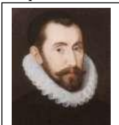
Sir Francis Walsingham

En el siglo XVIII comenzó otro tipo de transformación de poder, el del dinero , cuando banqueros individuales del Renacimiento como los Medici, Bardi, Peruzzi o Fugger,