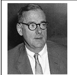
Richard Bissel Jr

En marzo de 1952, Richard M. Bissell redacta un texto de dieciséis páginas titulado « Crear las Condiciones para la Paz », en el que fija los lineamientos del próximo programa. Según el documento, « el objetivo de la Fundación debe ser contribuir a la creación de un contexto en el cual sea posible para Occidente, gracias a la nueva posición de fuerza militar que está llevando a cabo, negociar una paz justa y honorable con el Este ».